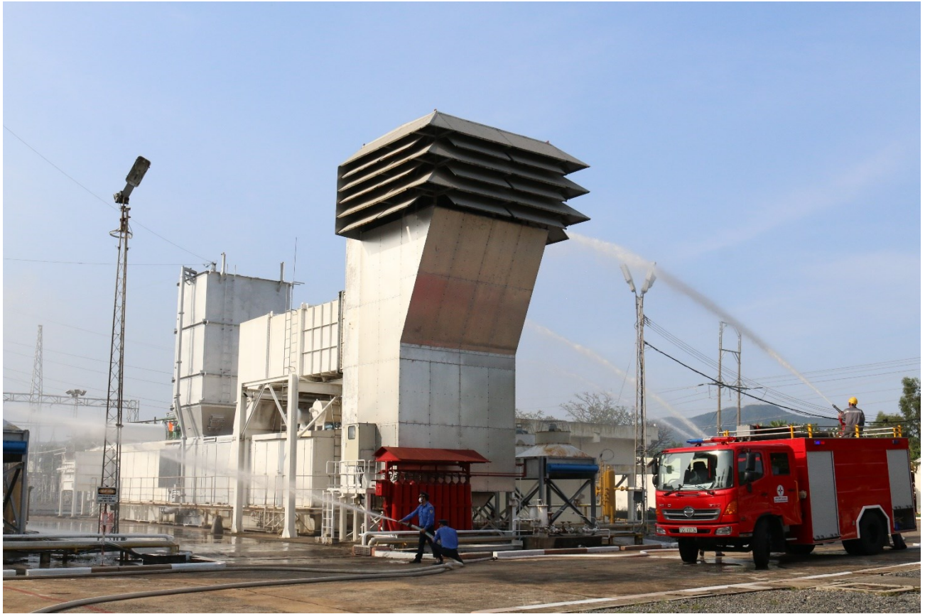
Phối hợp diễn tập phương án PCCC nội bộ